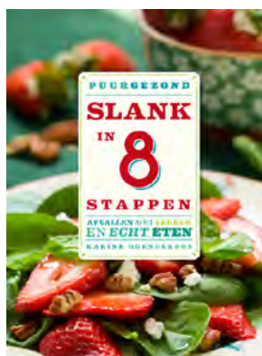
Slank in 8 stappen

Met de kortingscode OVERGANG ontvang je 3 euro korting op je bestelling (bij een bestelling van minimaal 10 euro).